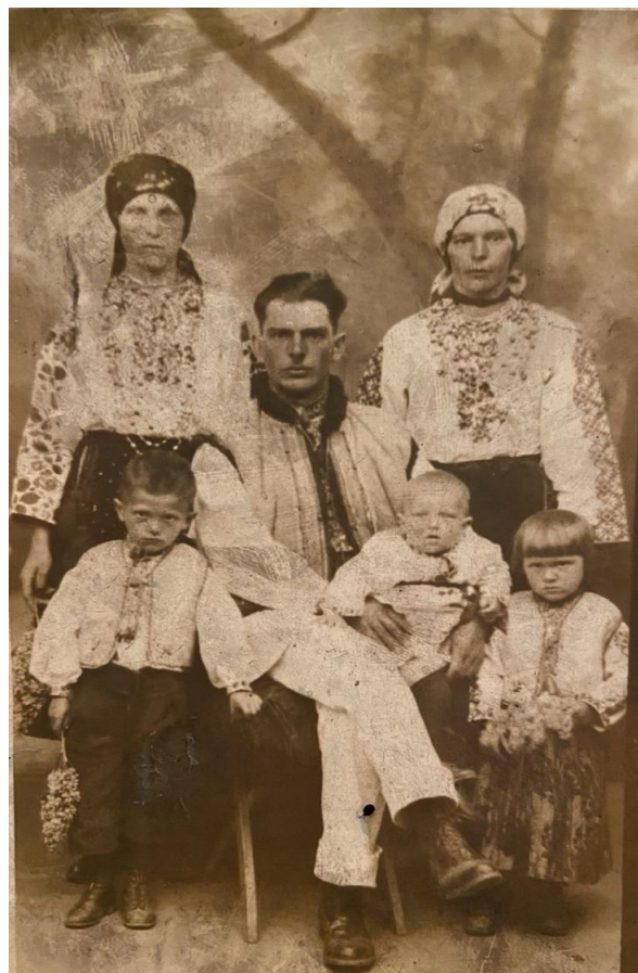
Ілюстрація 1. Родинний портрет, Коломийський район, Івано-Франківська область, 1930-ті роки.

Зауважимо, що нарівні з побутуючим, аскетичним комплектом вбрання, як і наприкінці ХІХ ст., так і протягом першої половини ХХ ст. вбрання дитини навіть від року-двох могло бути більш складним, багатокомпонентним, уподібненим до одягу дорослих. Залежно від достатку батьків та місцевості, святковий образ малюка міг включати в себе всі елементи строю, що, звісно, часто могли бути спрощеними, видозміненими, в деталях відрізняли дітей від дорослих. Яскраві приклади такого вигляду дітей ми зустрічаємо на фотографіях першої половини ХХ ст. (Іл. 1; 2).