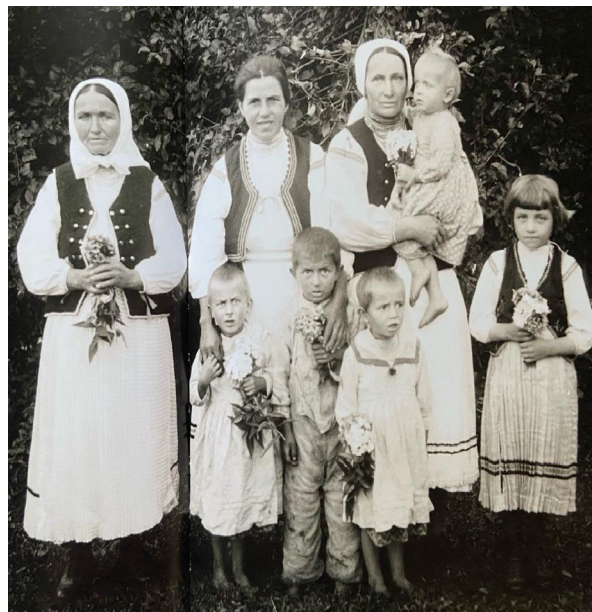
Ілюстрація 4. Група жінок та дітей з с. Куляшне, Сяноцький повіт (Польща), 1935 р.

Дитячий одяг, передусім святковий, наслідуючи ці тенденції, переважно копіював костюм дорослих. Інколи ми можемо зустріти переважання типів міського вбрання у дитячому строї, навіть порівняно з одягом дорослих, як на світлинах Р. Райнфуса 1930-х років з Лемківщини та Бойківщини 49 (Іл. 4). В інших регіонах України ми так само фіксуємо використання фабричної тканини для пошиття дитячого одягу, впровадження нових і нетипових форм 50 .