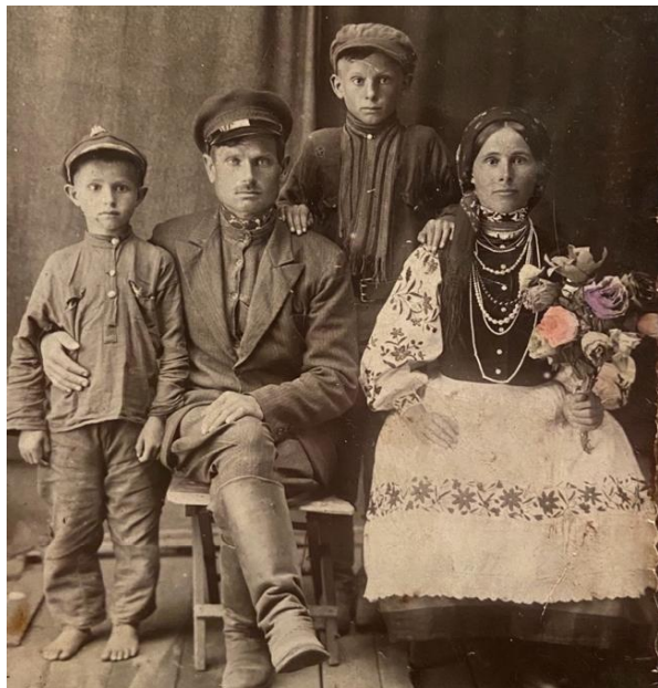
Ілюстрація 3. Родина з с. Немовичі, Сарненський район, Рівненська область, 1930-ті рр.

Протягом першої половини ХХ ст. українське традиційне вбрання зазнало багатьох змін, що відобразилося і в дитячому одязі. Найбільш характерні особливості цього процесу полягали у проникненні в селянський костюм елементів міського вбрання, що часто видозмінювалося, прилаштовувалося до локальної традиції. Широко використовувалася матерія фабричного виробництва, купувався готовий одяг та взуття, що був продуктом міської моди. Поступово традиційний стрій витіснявся з щоденного вжитку та використовувався лише на свята, особливо активно змінювався чоловічий костюм (Іл. 3).