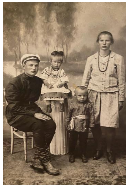
Ілюстрація 2. Родина з Ніжинського району Чернігівської області, 1930-ті роки.