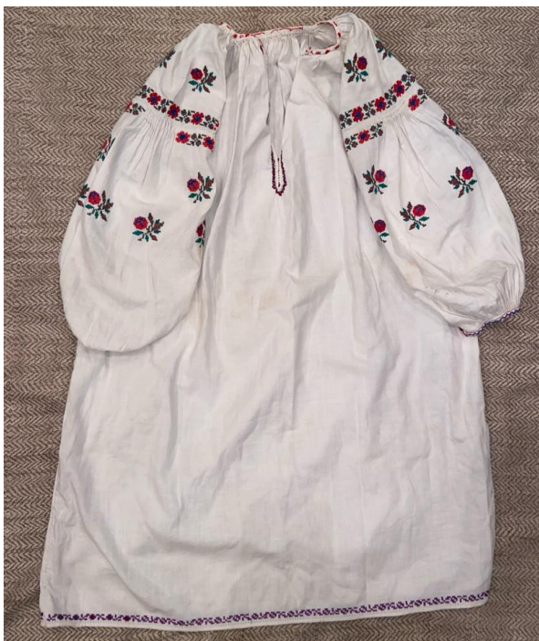
Ілюстрація 5. Сорочка для дівчинки, Миргородський район. Полтавська область, перша половина XX ст.