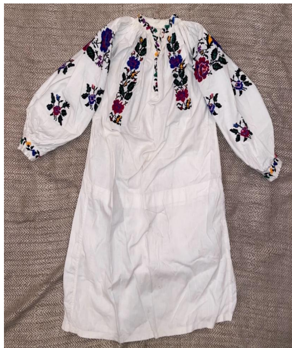
Ілюстрація 7. Сорочка для дівчинки, Жмеринський район, Вінницька область, перша половина XX ст.