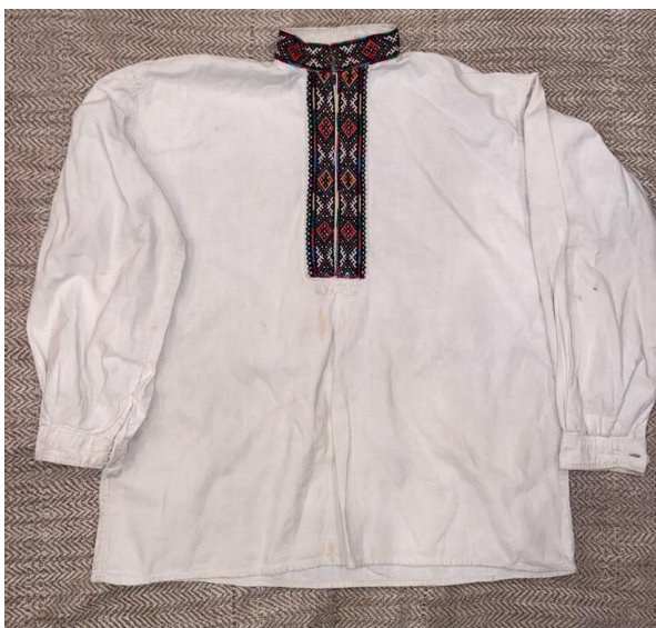
Ілюстрація 6. Сорочка для хлопчика, с. Нижній Студений, Хустський район, Закарпатська область, перша половина XX ст.

Висновки. Тож, традиційне дитяче вбрання протягом першої половини XX ст. зазнало змін, що відбувалися в контексті трансформації української традиційної культури. Збереження символічної ролі елементів одягу в обрядовості, пов'язаної з дитиною, протягом зазначеного періоду засвідчує дотримання давніх традицій, уявлень, збереження ролі одягу як інструмента соціалізації.