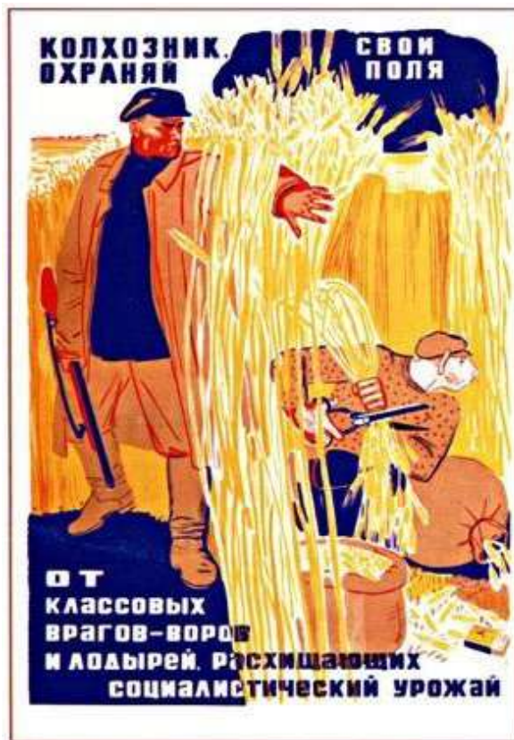
Рис. 8. Плакат В. Говоркова «Колгоспник, охороняй поля від класових ворогів – крадіїв і ледарів, що розкрадають соціалістичний урожай!». 1933 р.

відповідальність за прорахунки і формувалося поступове звикання до репресивних дій влади як виправданих.