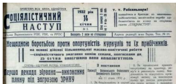
Рис. 1. Гасла на першій шпальті варвинської районної газети «Соціалістичний наступ». 14 січня 1932 р.

Формат газет максимально підпорядковувався завданням пропаганди. Класичні заголовки найбільш популярних новин на перших шпальтах були перетворені в радянській пресі на промовисті гасла. Більше того, часто вони утворювали самостійний блок концентрованої інформації, що зазвичай підкріплювався розміщеними тут же постановами центрального уряду чи партійних і державних органів влади регіонального рівня, тематичними редакційними замітками або дописами сількорів. Завдяки виразному шрифту, що домінував над іншими матеріалами, і лаконічно викладеній суті гасла стали прийнятною формою споживання інформації навіть для малописьменних читачів.