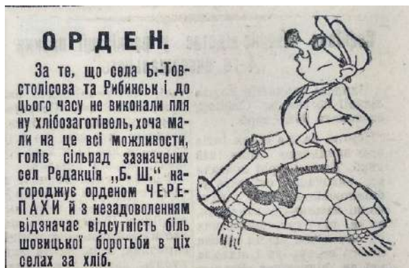
Рис. 4. Повідомлення, опубліковане в корюківській районній газеті «Більшовицький шлях». 9 січня 1933 р.

Іншим видом друкованої продукції, який активно використовувався комуністичною пропагандою, був плакат. Яскравими кольорами і сюжетами, що віддзеркалювали найбільш актуальні явища та події внутрішньополітичного життя, він приваблював увагу читачів, доносив інформацію оперативно і лаконічно, використовуючи великі літери у коротких гаслах, не обтяжливих для прочитання і сприйняття. Як зауважив у своїй доповіді М. Беккер, присвяченій сільськогосподарському плакату: «Потрібно вміти обрати коротке слово і поєднати його з художнім образом так, щоб воно одразу усвідомлювалось... Увага селян до плаката дуже велика. Це зобов'язує нас подумати серйозно над сільськогосподарськими плакатами. Треба вміти вибрати головне, відсіяти вторинне і вміло виразити так, щоб це подобалось селянам і разом з тим заряджало їх необхідними ідеями» [32]. Тематика плакатів початку 1930-х років включала практично всі питання суспільно-політичного й економічного життя країни. Не залишився осторонь і процес колективізації сільського господарства.