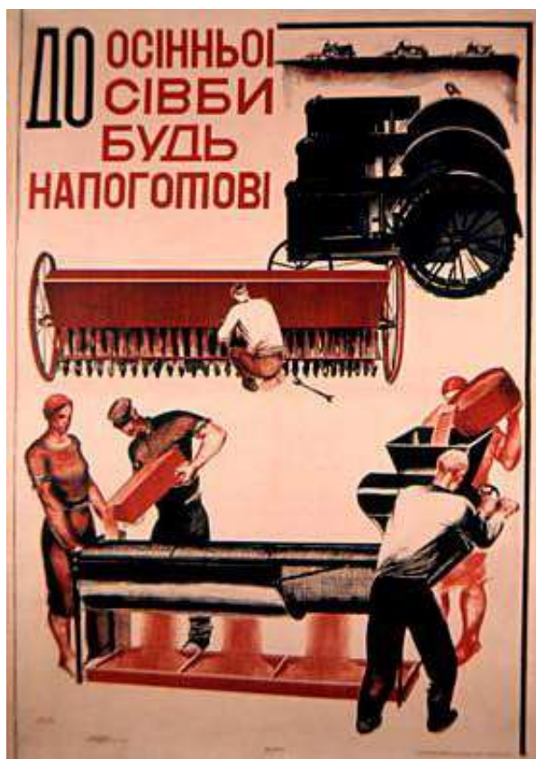
Рис. 7. Плакат М. Дерезуса «До осінньої сівби будь наготові!». 1931 р.

Лише прямими закликами до вступу в колгосп плакатна індустрія не обмежувалася. Зображення успішних, щасливих і усміхнених трудівників, які разом обробляють землю, засівають її чи збирають урожай ненав'язливо закріплювало у свідомості думку про переваги колективної праці. З іншого боку, надважливим завдання пропаганди було закріпити у соціумі сприйняття будь-якого рішення комуністичної партії та уряду як єдино правильного, такого, що не підлягає ніякому сумніву.