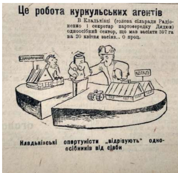
Рис. 2. Карикатура «Це робота куркульських агентів», опублікована в ніжинській районній газеті «Нове село». 23 квітня 1933 р.