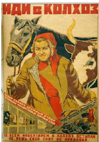
Рис. 5. Плакат М. Терсихорова «Йди до колгоспу!». 1930 р.

Іншим видом друкованої продукції, який активно використовувався комуністичною пропагандою, був плакат. Яскравими кольорами і сюжетами, що віддзеркалювали найбільш актуальні явища та події внутрішньополітичного життя, він приваблював увагу читачів, доносив інформацію оперативно і лаконічно, використовуючи великі літери у коротких гаслах, не обтяжливих для прочитання і сприйняття. Як зауважив у своїй доповіді М. Беккер, присвяченій сільськогосподарському плакату: «Потрібно вміти обрати коротке слово і поєднати його з художнім образом так, щоб воно одразу усвідомлювалось... Увага селян до плаката дуже велика. Це зобов'язує нас подумати серйозно над сільськогосподарськими плакатами. Треба вміти вибрати головне, відсіяти вторинне і вміло виразити так, щоб це подобалось селянам і разом з тим заряджало їх необхідними ідеями» [32]. Тематика плакатів початку 1930-х років включала практично всі питання суспільно-політичного й економічного життя країни. Не залишився осторонь і процес колективізації сільського господарства.