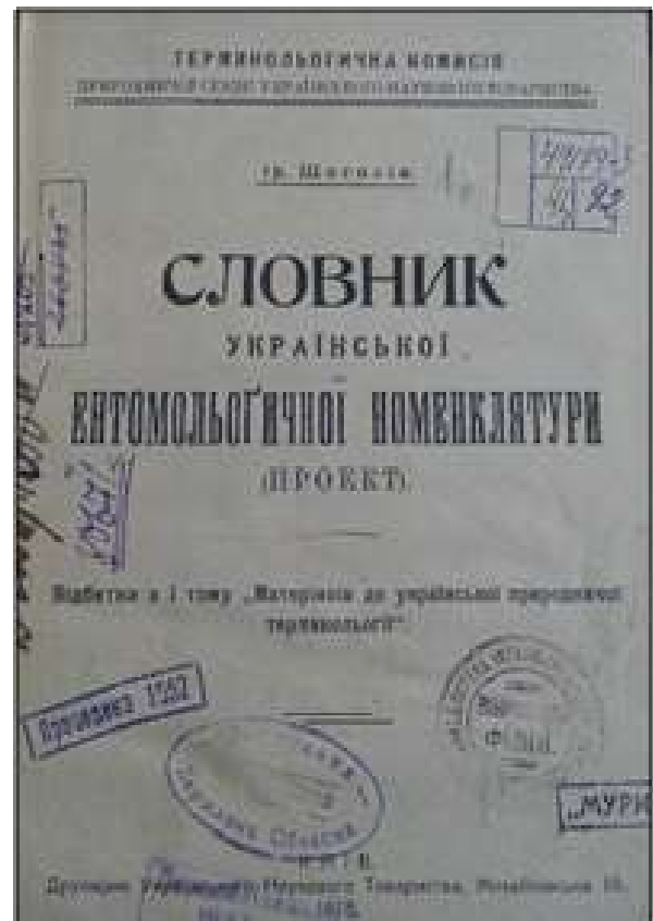
Рис. 1. Титульний аркуш «Словника української ентомологічної номенклатури» І. Щоголева (1918)

та «Словник української ентомологічної номенклатури» І. Щоголева (1919–1920) [15].