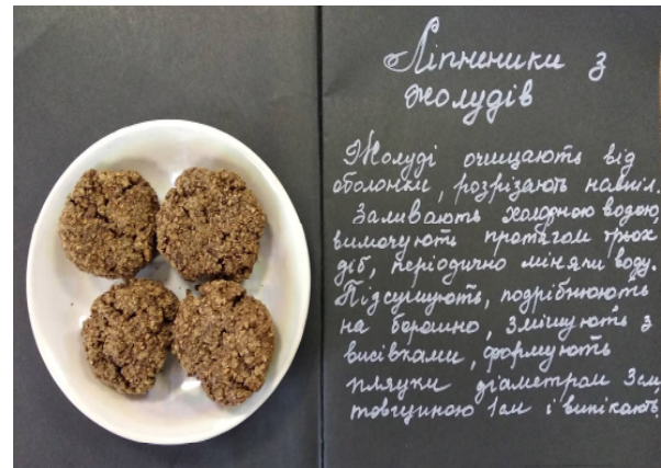
Рис 1. Рецепт і зовнішній вигляд «Ліпнеників із жолудів»

експонати) до Національного музею Голодомору-геноциду. Науковці приготували «страви», які змушені були їсти українці у 1932–1933 рр., аби вижити.